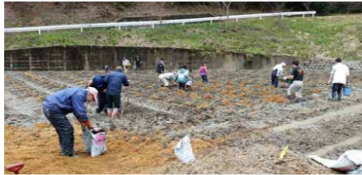
(上)(下)桑の苗を植栽の様子

4/9(日)、耕作放棄地で桑を栽培し、桑茶、パウダーに加工販売する六次産業化に取り組むNPO法人マルベリークラブ中部(名古屋市)が、センターのマッチングにより旭地区押井町の遊休水田で桑の苗の植栽を行いました。