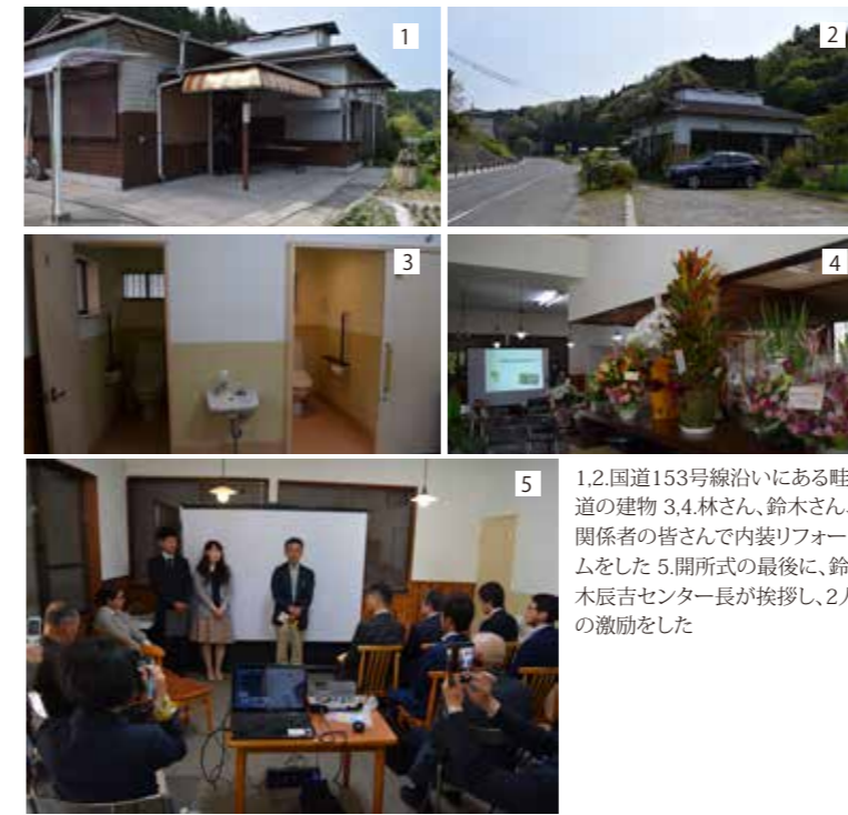
1,2.国道153号線沿いにある睦道の建物 3,4.林さん、鈴木さん、関係者の皆さんで内装リフォームをした 5.開所式の最後に、鈴木辰吉センター長が挨拶し、2人の激励をした

進路に迷っていた時、実習先の精神科病院で患者さんに、「やりたいことをやってみたらいい」と背中を押されたことがきっかけで、碧南市の精神障がい者の作業所で働き始めます。