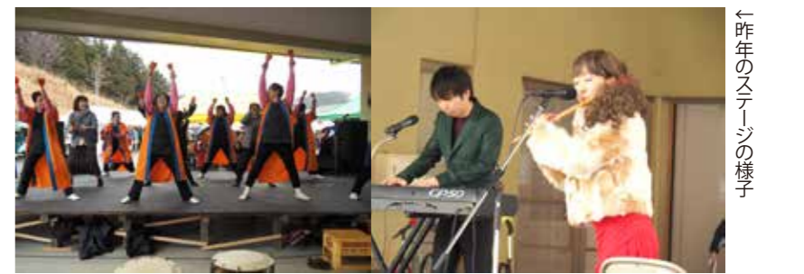
←昨年のステージの様子