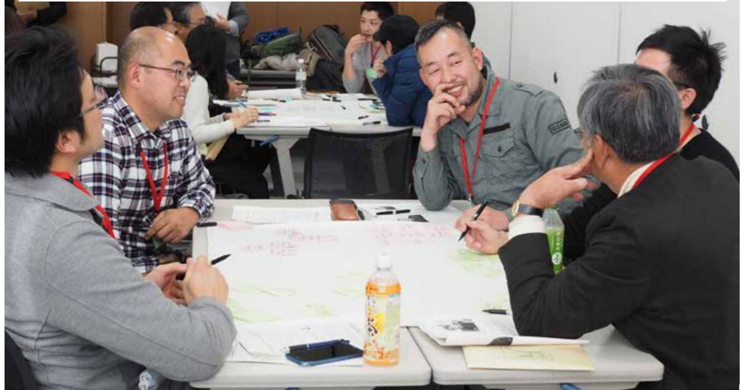
第2部くるま座談義、分科会①の移住定住&スモールビジネス研究会のグループトークの様子