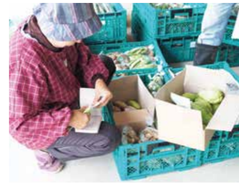
たくさんの種類の野菜を出荷している様子