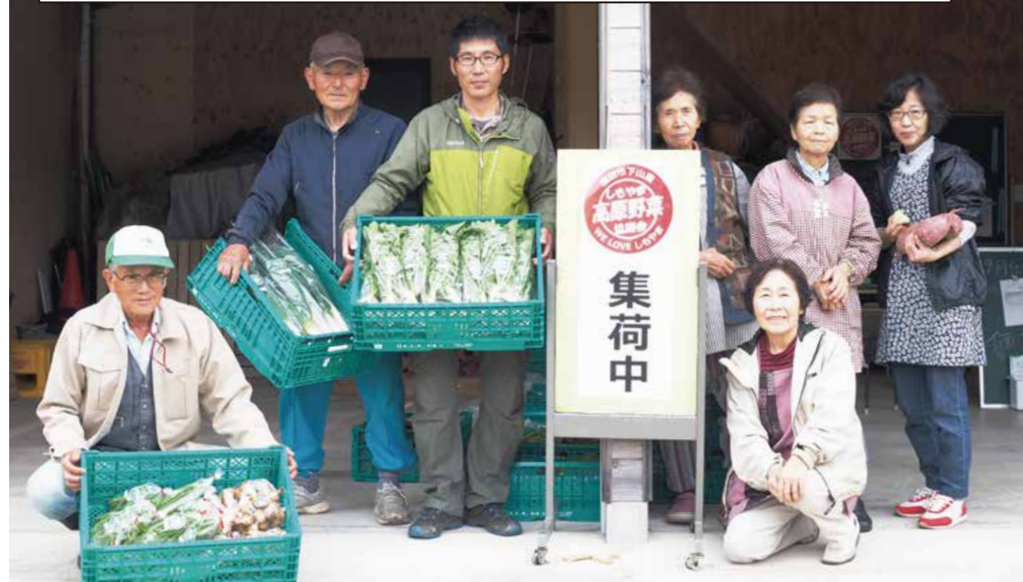
10月19日(金)に野菜を出荷したしもやま高原野菜協議会のメンバー