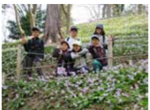
足助地区での様子

帰宅後、保護者の方から、「家の手伝いを行ったり、積極的に自分から話しかけたりするようになった。」との声も届いていて、子どもたちの成長につながったことが伺えます。(田中敦子)