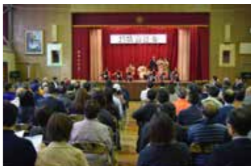
350名もの参加があった

がすでに整い、手づくりのカフェや休憩室も出来上がっています。つくラッセルが掲げている「つどう、はたらく、つくる拠点」としての機能に期待が高まります。(木浦幸加)