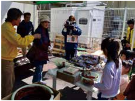
キャラクター型の五平餅に、子ども達が味噌を塗っていた

このイベントは、参加者の方に、下山地区の魅力を知ってもらうだけでなく、地元の皆さんの結束力を確かめる貴重な機会にもなりました。(田中敦子)