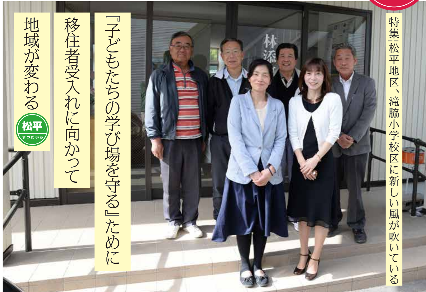
特集「松平地区、滝脇小学校区に新しい風が吹いている」