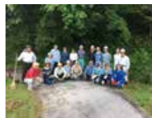
よきパートナーとなり、地域が活気づいていくようこれから取り組んでいきます。(坂部)

7/2(日)、三ツ久保町(小原地区)の環境美化活動に応援隊6人とスタッフ3人で参加し、林道沿いの草刈りを住民と行いました。三ツ久保町は世帯数16戸、人口40人程の過疎高齢化がすすむ集落。このままでは集落の存続が危ぶまれると住民が危機感をいだき、昨年度、地域ビジョンをつくりあげるワークショップを3回開催し、5つのアクションプランを決定しました。応援隊受入れもそれに位置づけられています。三ツ久保町として、いわゆる“よそ者”を受入れるのは初めて。今日はそれに刺激されて地元の参加者も増えたそうです。都市住民との交流はこうした思わぬ副次効果も生みだしてくれます。三ツ久保町と応援隊が