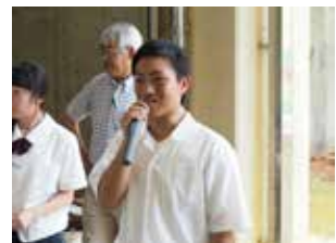
感想を述べる男子生徒