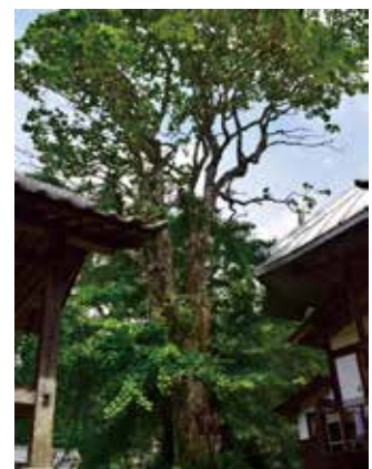
下山地区で最大の巨木クロガネモチ

熱心にうんうんと頷きながら聞いて頂ける方もあり、自分事と捉えてご家庭でも話し合って頂くようお願いしました。(西田)