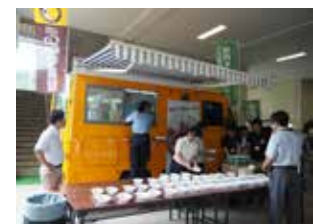
(株)ワイズのキッチンカーで提供