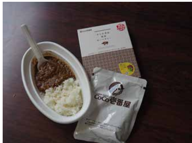
試食会で提供されたカレーと、レトルトのパッケージ外装

商品開発で、地域貢献(株)ワイズは、おいでん・さんそんセンターのマッチングにより、旭地区の伊熊町で、「農業による社員研修、地域貢献、商品開発」を目的に活動しています。28年度には、地元の伊熊宮農クラブの指導で米を作り、オリジナルの日本酒と純米本みりんを開発、販売しました。29年度は、自社として初めてのレトルト