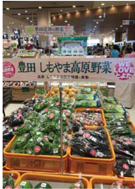
イオンスタイル豊田の店頭と並ぶしもやま高原野菜