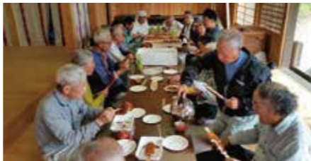
(上)台風で傾いたサクラを立て直す作業 (下)共に食卓を囲む地元住民と応援隊の皆さん