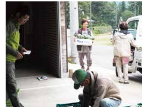
意気揚々と出荷してくる農家のお母さん