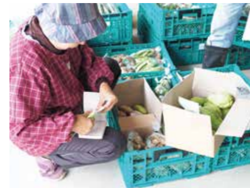
たくさんの種類の野菜を出荷している様子