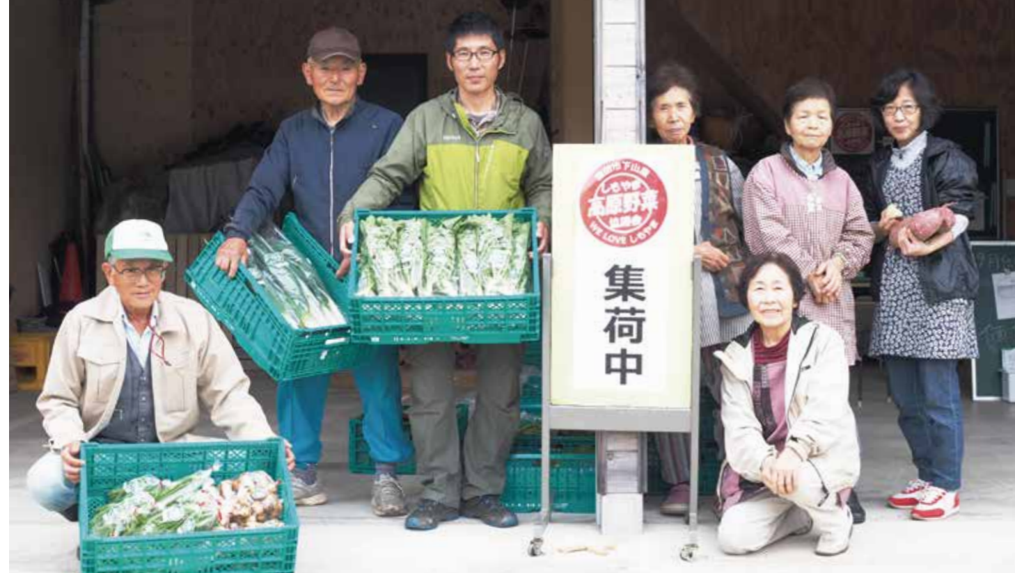
10月19日(金)に野菜を出荷したしもやま高原野菜協議会のメンバー